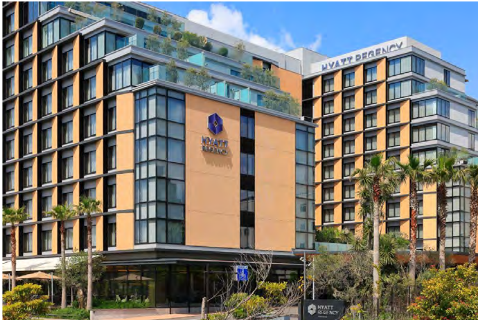
ハイアットリージェンシー 東京ベイ 外観 (千葉県浦安市)

ハイアットリージェンシー東京ベイは、東京ディズニーリゾート®や幕張メッセ、また都心からアクセスの良い浦安市のベイエリアに位置した、東京湾を望むアーバンリゾートホテルです。客室は10室のスイートを含む全350室、最大6名（大人4名、添い寝でお子様2名）でご利用可能なファミリールーム、東京湾を一望できるオーシャンビュールーム、広々としたテラスがついたテラスルームなど、目的やお好みに応じてお選びいただける多様な客室タイプをご用意しています。