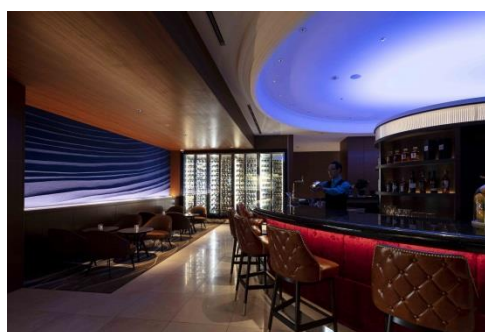
ナインドットバー