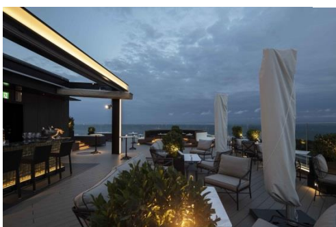
ルーフトップバー