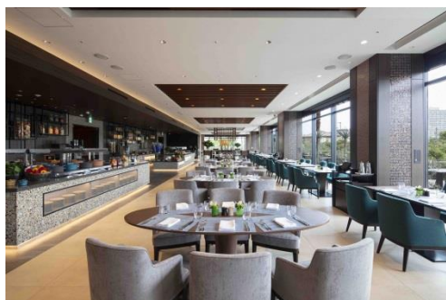
ギャラリーキッチン