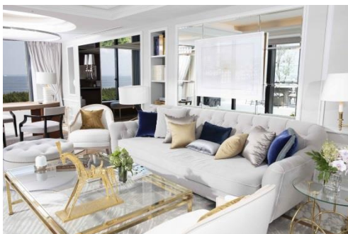
チェアマンスイート